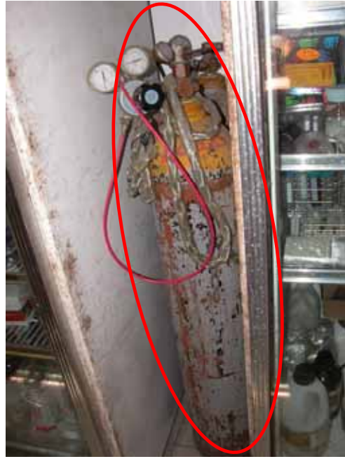
圖 2 高壓氣瓶沒有固定(生化館 203)