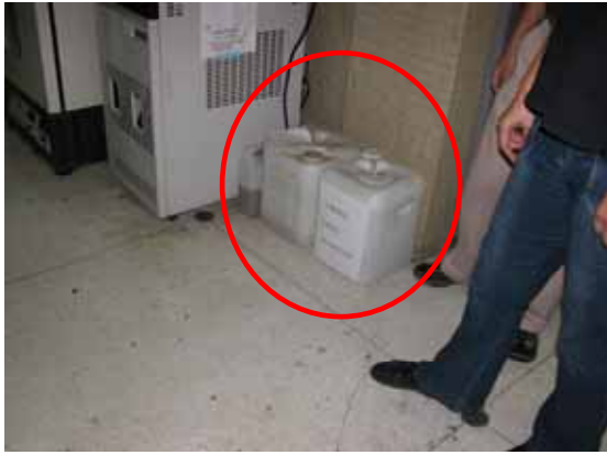
圖 7 廢液放置於走廊(生化館 N201)