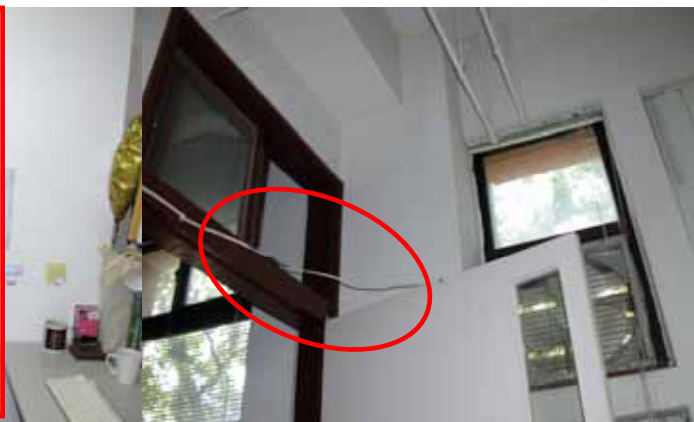
圖 10 電線未固定(農化二館 214)