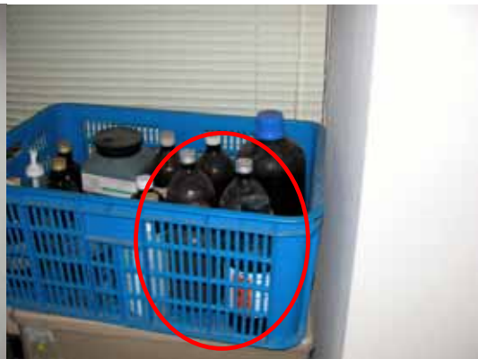
圖 4 有機溶液放置不當(農化二館 214)