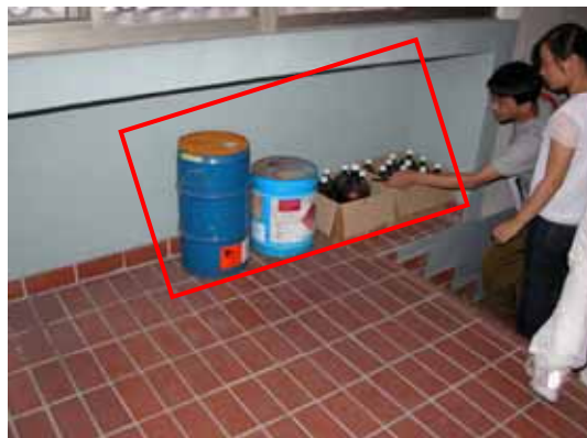
圖 6 在樓梯間隨置之空罐及瓶(生科館 8 樓)