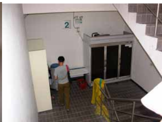
圖 16 充斥在樓梯間的雜物(農化二館梯間)