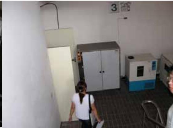
圖 14 充斥在樓梯間的雜物(農化二館梯間)