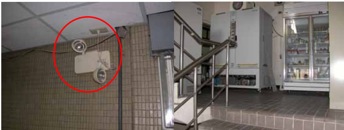
圖 11 緊急照明燈損壞(生化館 N201 門前)