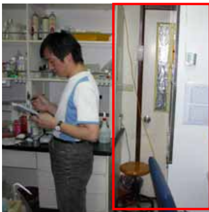
圖 9 無菌操作檯擋著門口(農化二館 510)