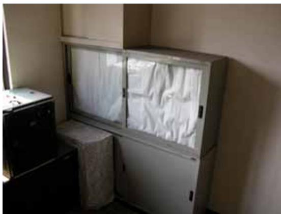
圖 15 充斥在樓梯間的雜物(農化二館梯間)