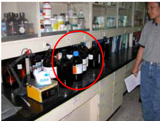
圖 5 毒性化學物品隨意放在桌上(漁科館 303)