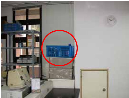
圖 3 有機溶液放置不當(農化二館 214)