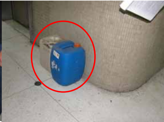
圖 8 廢液放置於走廊(生化館 N201)