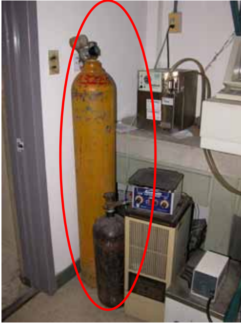
圖 1 高壓氣瓶沒有固定(生化館 N201)