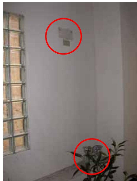
圖 18 緊急照明損壞(生化館走廊)