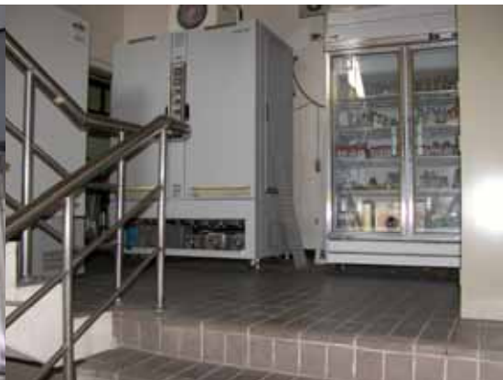
圖 12 充斥在樓梯間的冰箱(農化二館梯間)